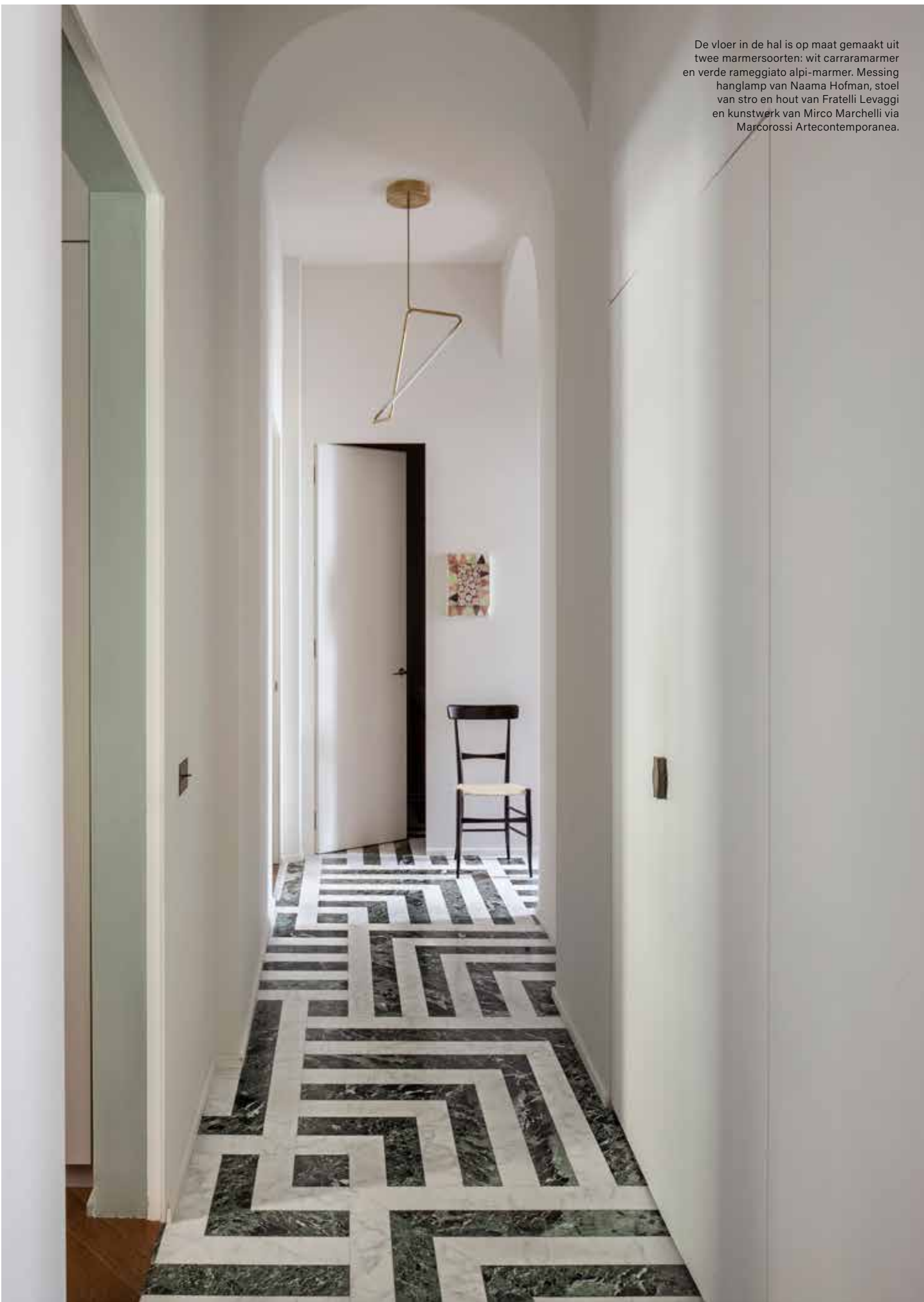
De vloer in de hal is op maat gemaakt uit twee marmersoorten: wit carraramarmer en verde rameggiato alpi-marmer. Messing hanglamp van Naama Hofman, stoel van stro en hout van Fratelli Levaggi en kunstwerk van Mirco Marchelli via Marcorossi Artecontemporanea.