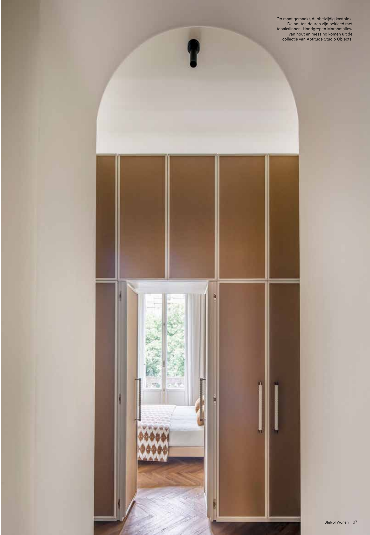
Op maat gemaakt, dubbelzijdig kastblok. De houten deuren zijn bekleed met tabakslinnen. Handgrepen Marshmallow van hout en messing komen uit de collectie van Aptitude Studio Objects.