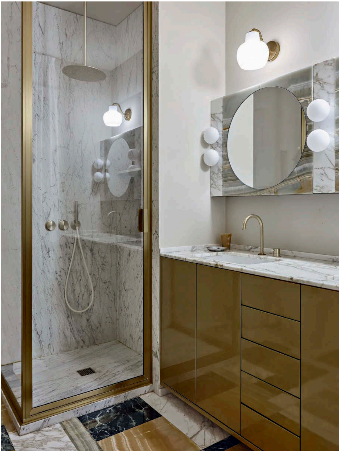
SOPRA Il bagno padronale, cui si accede dalla cabina armadio. Pavimento in marmi policromi, mobile e specchio contenitore su disegno. Rubinetteria di Cea. PAGINA ACCANTO Nella camera da letto padronale testata su disegno. Lampadario Artichoke di Poul Henningsen (Louis Poulsen). Tende in tessuto Dedar, applique Okla di Simone&Marcel, comodino e panca vintage.